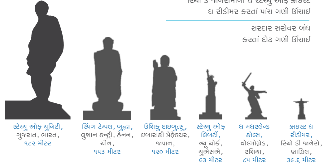
સ્ટેચ્યુ ઓફ યુનિટી, ગુજરાત, ભારત, ૧૮૨ મીટર